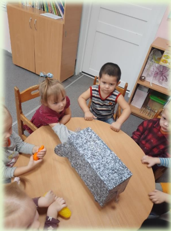
Д.и.: «Чудесный мешочек»